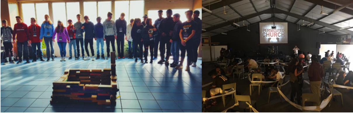
YWAM Berdoa bagi Gereja yang Dianiaya