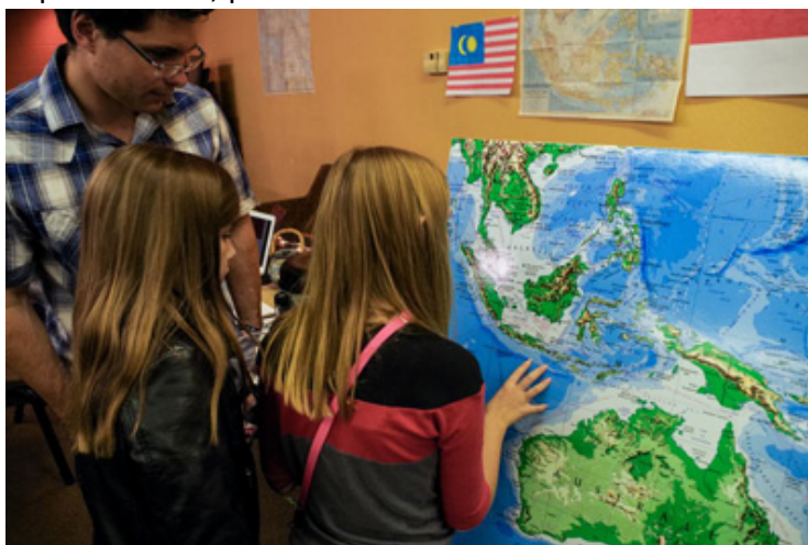
JOCUM Redding ora pela igreja perseguida.

Junte-se à JOCUM pelo mundo, para orar e escutar a voz de Deus. Ele está te convidando!