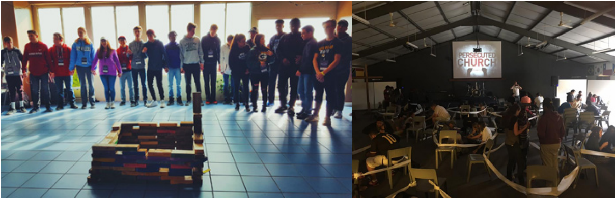
JuCUM ora por la iglesia perseguida